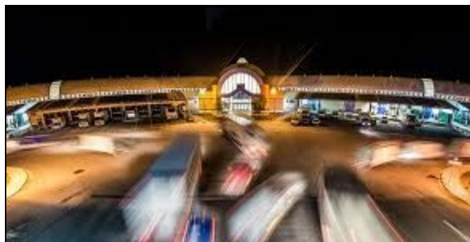
Il Mercato Agroalimentare della Sardegna (Sestu - Cagliari)

Dopo Roma, Milano, Torino, Firenze, Napoli, Bologna e Verona, anche Cagliari da oggi fa ufficialmente parte della Rete d'Imprese Italmercati. L'annuncio è stato dato al termine del Comitato di Gestione svoltosi il 6 maggio 2016 a Verona, a margine di Fruit&Veg System, dal presidente Fabio Massimo Pallottini: "Abbiamo ritenuto di accettare in Italmercati questo grande mercato regionale, forte di 70 operatori, che ci aveva chiesto lo scorso aprile di aderire alla Rete. E penso che la soddisfazione sia reciproca. Il Mercato di Sestu, che movimentava in un anno oltre 150 mila tonnellate di ortofrutta, ed ha una gestione completamente privata, è infatti un altro tassello di un disegno nazionale che deve