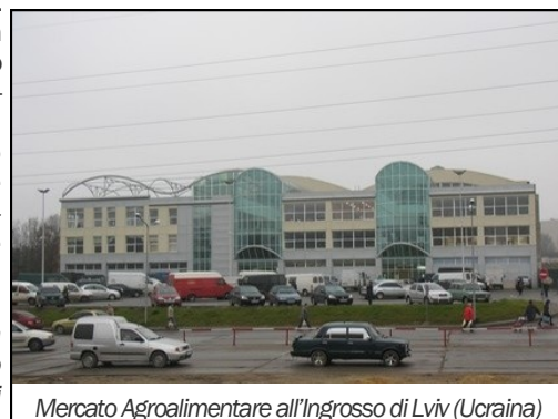
Mercato Agroalimentare all'Ingresso di Lviv (Ucraina)

dei Mercati in Ucraina e dell'interesse a rafforzare i rapporti con il nostro Paese che non sono, nel nostro settore, particolarmente forti pur nascondendo potenzialità inesprese che insieme potremmo individuare e sviluppare. Ci avete chiesto di considerare la possibilità di stendere un Memorandum of Understanding tra la vostra Unione e Italmercati. Noi siamo disponibili a valutare questa possibilità e all'interno di essa di prevedere di agevolare lo sviluppo dei commerci tra i nostri Mercati, in particolare tra quelli più prossimi alla frontiera orientale del nostro Paese come Verona, e i vostri Mercati, in particolare Lviv, tradizionale porta d'ingresso del commercio ortofrutticolo in Ucraina".